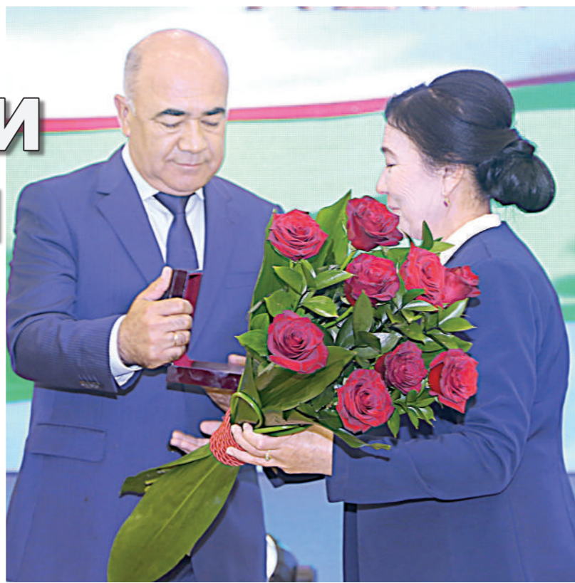
(Давоми. Бошланиши 1-саҳифада)

Таъкидлаш лозимки, давлатимиз томонидан таълимга берилётган эътибор самарасида бу йил вилоятда 887 та давлат умумтаълим мактаби билан бир қаторда 2 та нодавлат, 17 та хусусий мактаб ҳам самарали фаолият кўрсатмоқда. Вилоятдаги 13 та (7 та давлат, 6 та нодавлат) олий таълим муассасасида жами 67 мингдан зиёд талаба тахсил оляпти. "Инсонга эътибор ва сифатли таълим йили"да мактаб таълимига берилётган эътиборнинг меваси сифатида битирувчиларнинг 1 минг 215 нафари муддати-