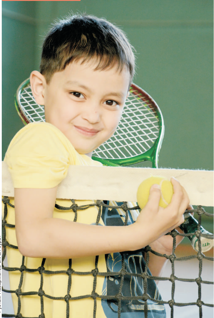
Рустам Назарбаев олган сурат