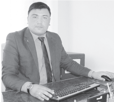
(Давоми, бошланиши 1-саҳифада)

Университет бошланғич ташкилоти кенгаши тўққиз нафар энг фаол талабадан иборат. Улар факультет ва талабалар тураржойларидаги сардорлардир. Ҳарқалай, мазкур олий ўқув юртида Ҳаракатнинг ташкилий тузилмаси биров ноодатийлиги билан фарқланиб туради. Сабаби ўтган ўқув йилида бошланғич ташкилот қошида Маънавият ассоциацияси тузилди. Уни ташкилот ичидаги ташкилот дейиш мумкин. Ассоциацияга 150 нафардан зиёд иқтидорли йигит-қиз бирлашган. Талабалар ўз қизиқишига кўра турли клубларни ташкил қилиб, ўзларида юритиб келмоқда. Ҳозир Маънавият ассоциацияси таркибида журналистика, сиёсат майдони, бизнес, санъат, ахборот технологиялари йўналишларида клуб ва тўғараклар, тил ҳамда психологик хизмат марказлари фаолият кўрсатмоқда.