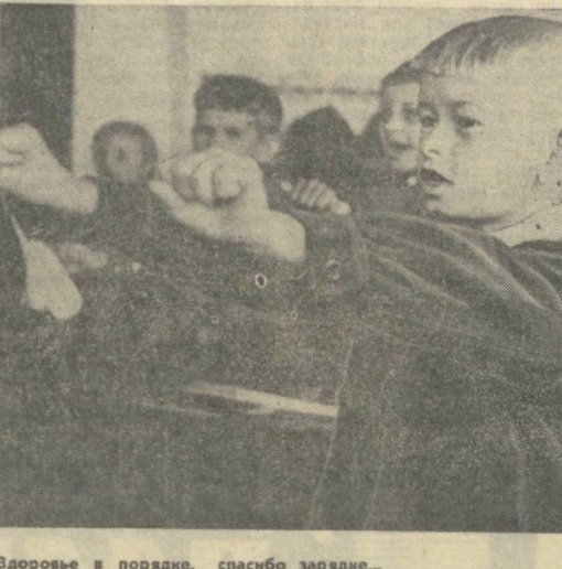
Здоровье в порядке, спасибо зарядке...