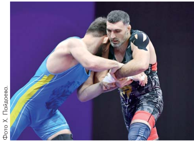
Эльдор САТТОРОВ, «Народное слово».

борьбе. Она стала первой узбекистанской спортсменкой, которая поднялась на пьедестал почести игр в этой дисциплине. Кеунимжаева, выступающая в весовой категории до 50 кг, одолела Пуджу из Индии в борьбе за бронзовую медаль.