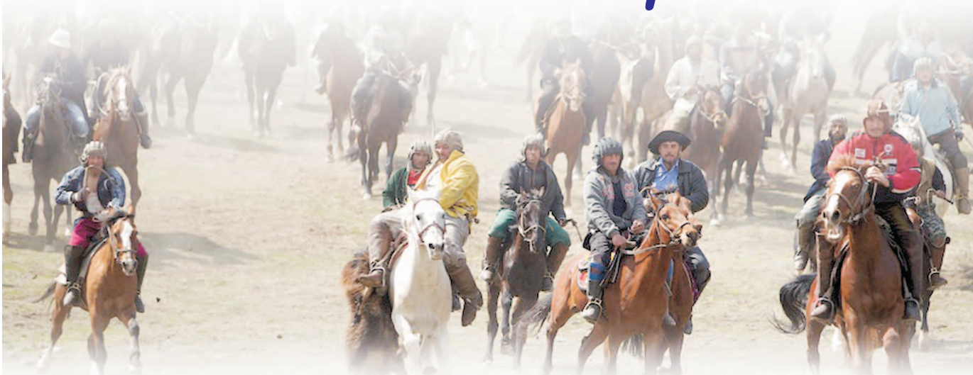
(Давоми, бошланиши 1-саҳифада)

Ўзбек халқига хос миллий қадриятлар ҳам узоқ йиллар давомида шаклланди, тараққий этди. Халқимизнинг асрий анъаналари, урф-одат ва қадриятлари унинг миллий ўйинларида ҳам ўз аксини топган. Асрлар довоидан эсон-омон ўтиб, сайқаланиб келаётган халқона руҳдаги ўйинлар бугун ўз қадриятини топди. Улар аждодларимизнинг ижодий салоҳияти, маънавий ва жисмоний талаб-эҳтиёжлари негизидан ижод этилган, бугунги кунда ҳам шу мақсадларга хизмат қилиб келади.