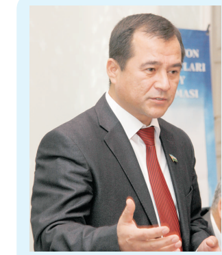
Иқбол Мирзо, Олий Мажлиси Сенати аъзоси, Ўзбекистон Ёзувчилар уюшмаси раиси ўринбосари, Ўзбекистон Халқ шоири:

— Залга кириб келишимиз билан кўргазмага гувоҳ бўлдик. У ерда ёшларнинг ҳаётга татбиқ этилган инновацион ғояларини кузатиб, гурурланасан, киши. Аслида, ишбилармонлик, билимдонлик, зукколик, изланувчанлик ўзбек халқига хос бўлган фазилат. Муҳтарам юртбошимиз раҳнамолигида мана шундай талантиларни, иқтидор соҳибларини қўллаб-қувватлаш, уларга шароит яратиб бериш бугунги куннинг муҳим масалалари қаторида турибди. Бу илм соҳасида дейсизми, ишлаб чиқаришимиз, спортми, санъатми, адабиётми — ҳамма соҳани қамраб олади. Бизнинг ёшларимиз дунё билан бўйлашадиган ёшлардир. Бугунги конференцияда ана шундай ташаббускор, ғайрат-шижоатга тўла ёшлар қатнашмоқда.