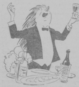
Рис. Н. Леушина.

Рат народ наш гостям. По бывает порою обидно: Среди тысяч гостей Иногда приезжает такой — В дружбе вечной клаясь И хвалит в глаза, как Ехидна, А домой возвратясь, Занимается клеветой.