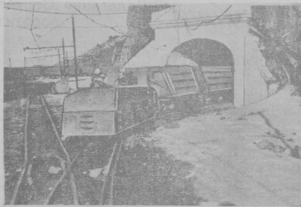
Новейшей техникой оснащаются предприятия Алмалыка — центра цветной металлургии Узбекистана. На снимке: доставка руды электровозами из подземного рудника на станцию подземной железной дороги на Алтын-Топанском свинцово-цинковом комбинате.

В номере много фотографий, хорошо иллюстрирующих материалы.