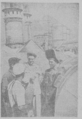
Корейская Народно-Демократическая Республика. Советские специалисты оказывают большую помощь на строительстве фабрики искусственных удобрений в Хыннамне. В будущем году вступит в строй новый нитро-аммонийный цех производительностью 136.000 тонн нитро-аммония в год. На снимке: советские и корейские специалисты на строительстве Нового цеха.

Уже второй день нескончаемым потоком идут трудящиеся Румынии в Джорджу республия. С объявленными головами входит в зал делегации рабочих и крестьян из различных областей и районов Румынской Народной Республики, представители государственных учреждений, военнослужащие, преподаватели интеллигенции, студенты, пионеры и школьники, чтобы проститься с верным сыном румынского народа товарищем Петру Гроза. Проститься со своим земляком прибыла делегация крестьян села Бачина Хунедоарской области, где родился Петру Гроза. В залах дворца множество венков, увитых траурными лентами, на которых в простых и задумчивых словах выражены чувства любви и благодарности Председателю Президиума Великого Национального собрания.