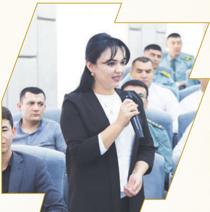
Mayor Farida BOBOJONOVA DXX Chegara qo'shinlari

Respublikamiz bo'ylab harbiy qism va bo'linmalarda tashkil etilib, avlodlar vorisligini ta'minlashga qaratilgan mazkur keng qamrovli tadbirlar fidoyi, yurtga sadoqatli va asl vatanparvar yoshlarni tarbiyalashda muhim omil bo'lib xizmat qilishi shubhasiz.