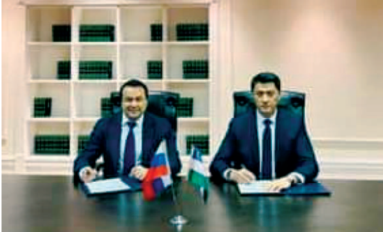
← Давоми. Боши 1-бетда

Россияга таширф доирасида тиббиёт соҳаси бўйича қандай келишувларга эришилди?