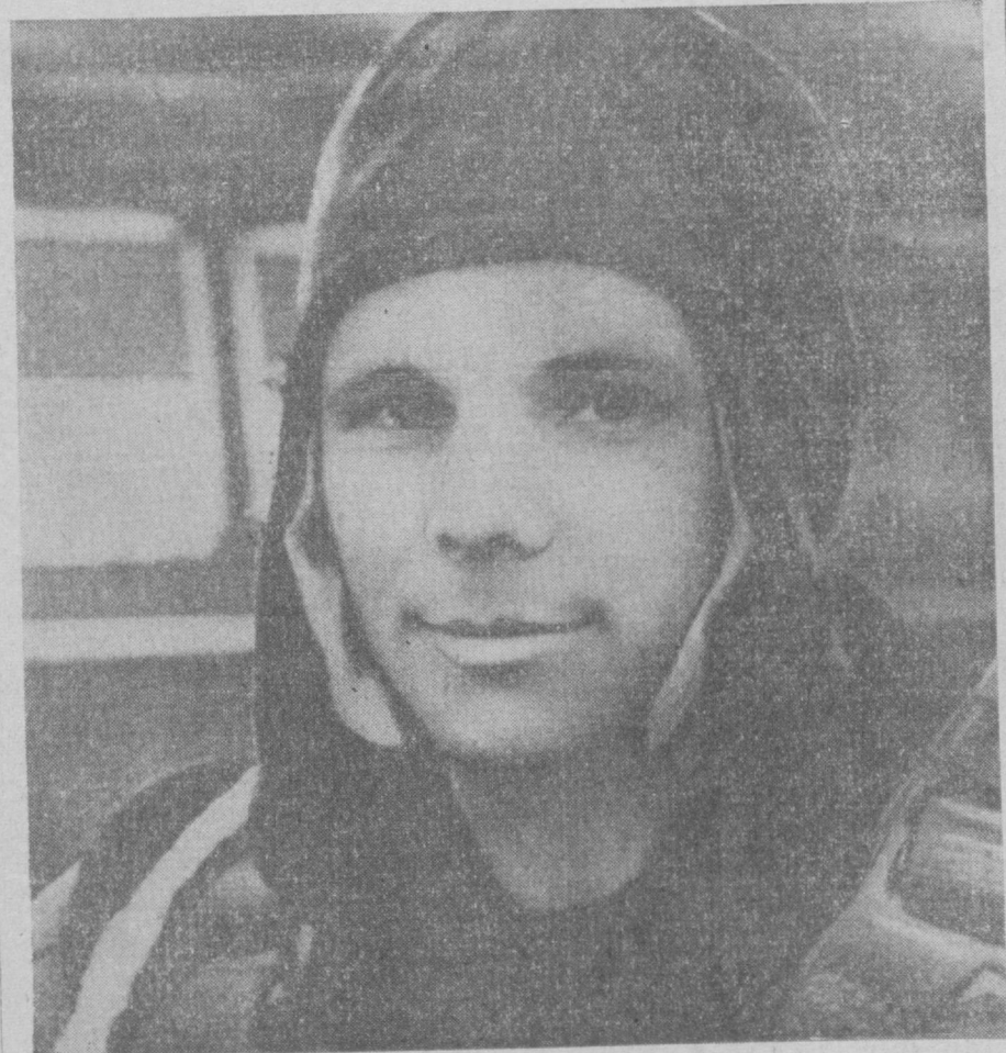
ЮРИ АЛЕКСЕЕВИЧ ГАГАРИН.

Поток телеграмм не прекращался в течение всего дня.