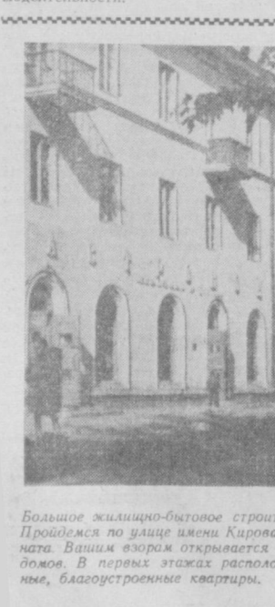
Большое жилищно-бытовое строительство развернулось в Маргелане. Проидея по улице имени Кирова в направлении шелкового комбината. Вашим взором открывается панорама новых трехэтажных домов. В первых этажах расположены магазины, в верхних — удобные, благоустроенные квартиры.