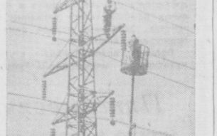
Первую очередь строительства Ферганского азотнокислого завода выстроили за три недели к открытию XXII съезда КПСС. Работы сейчас на всех участках ведутся с опережением графика. На СНИМКЕ: подвеска проводов высоковольтной линии электропередачи.

Мы призывает всех работников легкой промышленности по-боевому развернуть социалистическое соревнование в честь XXII съезда КПСС и с честью выполнять обязательства, все свои силы, всю энергию отдавая выполнению великих задач коммунистического строительства».