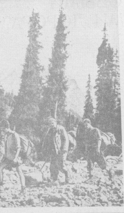
Узбекские авиационники в туристическом походе по западным отрогам Тянь-Шаня.