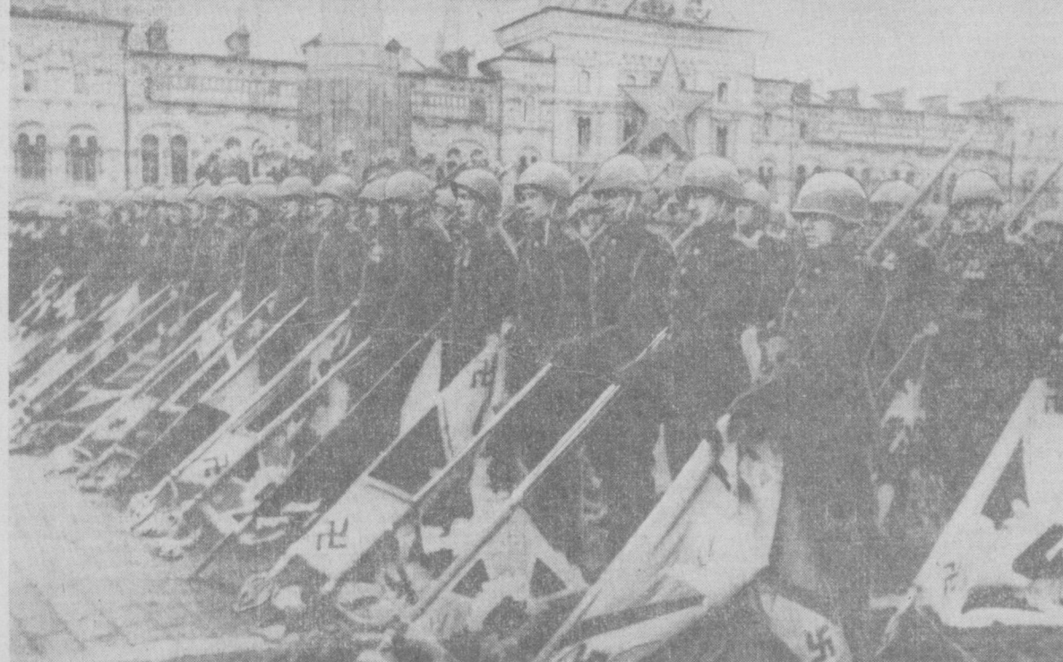
Парад Победы на Красной площади в Москве 24 июня 1945 года. НА СНИМКЕ: советские воины с захваченными и немецкими войсками знаменами.

20 июня Председатель Совета Министров СССР Н. С. Хрущев принял в Кремле посла Иракской Республики в СССР Абдель Вахаб Махмуда в связи с его предстоящим отъездом из Советского Союза и имел с ним дружественную беседу.