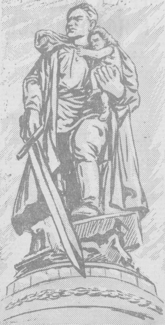
Монумент советского воина-освободителя в Третп-парке в Берлине. Скульптура Е. Вучетича.

Страна превращалась в единый боевой лагерь, перестраивала экономику на военный лад. Тысячи промышленных предприятий