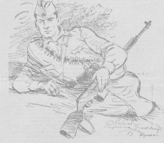
Из фронтового альбома художника