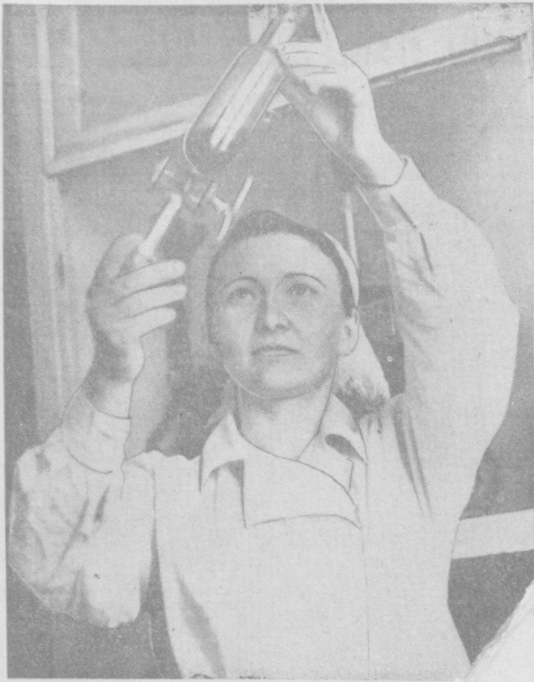
250 тонн комбинированных кормов в сутки дает новосибирского мелькомбината № 2 для животноводческих ферм Новосибирской области. Сейчас идет капитальный ремонт цеха жмыховая линия. Будет установлен мощный вентилятор, который пыльный воздух. Недавно при цехе организована лаборатория, которая следит за качеством продукции.