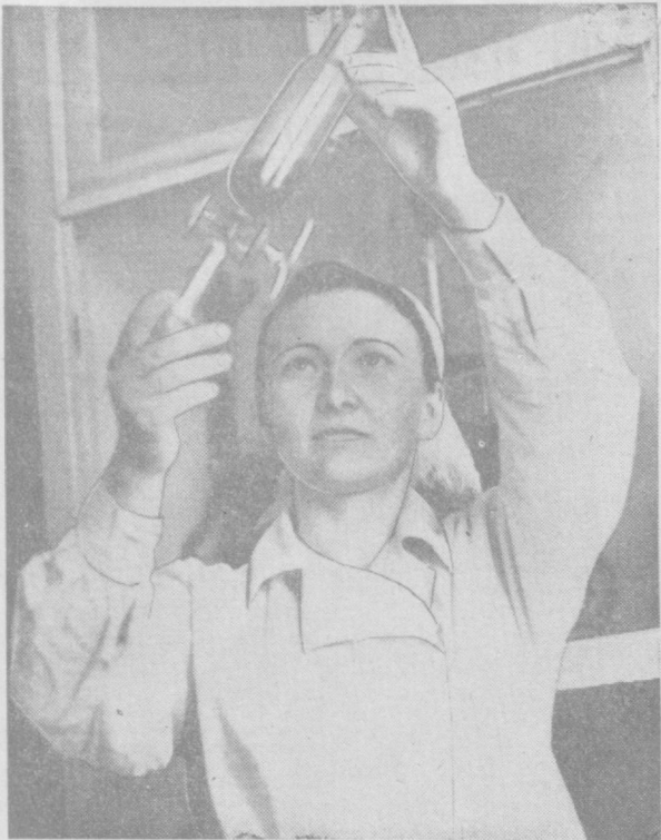
250 тонн комбинированных кормов в сутки дает новый цех Ташкентского мясокомбината № 2 для животноводческих ферм колхозов и совхозов республики. Сейчас идет капитальный ремонт цеха. Переоборудуются жемчужная линия. Будет установлен мощный вентилятор, отсасывающий от машин пыльный воздух. Недавно при цехе организована химическая лаборатория, которая следит за качеством продукции.