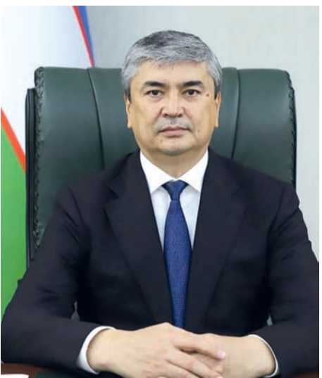
Бахром Норқобилов. Председатель Государственного комитета ветеринарии и развития животноводства РУз.