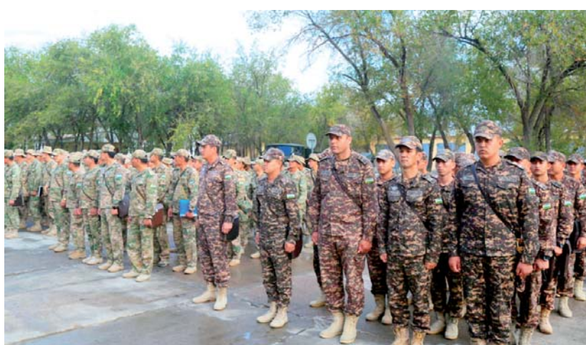
репленного за ними вооружения и военной техники.

В частности, военнослужащие проводят на боевых машинах и автотранспортных средствах замену охлаждающей жидкости и смазочных материалов, проверку всех узлов и агрегатов, электрооборудования, средств связи. Каждый командир и каждый военнослужащий несут ответственность за исправность и готовность к применению за-