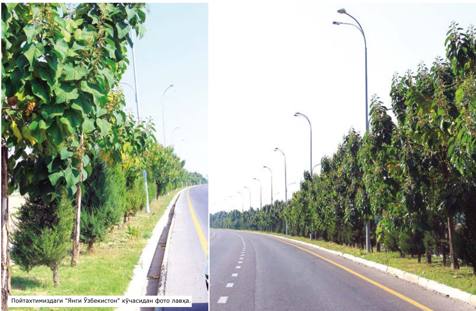
Пойтахтимиздаги "Янги Ўзбекистон" кўчасидан фото лавҳа.