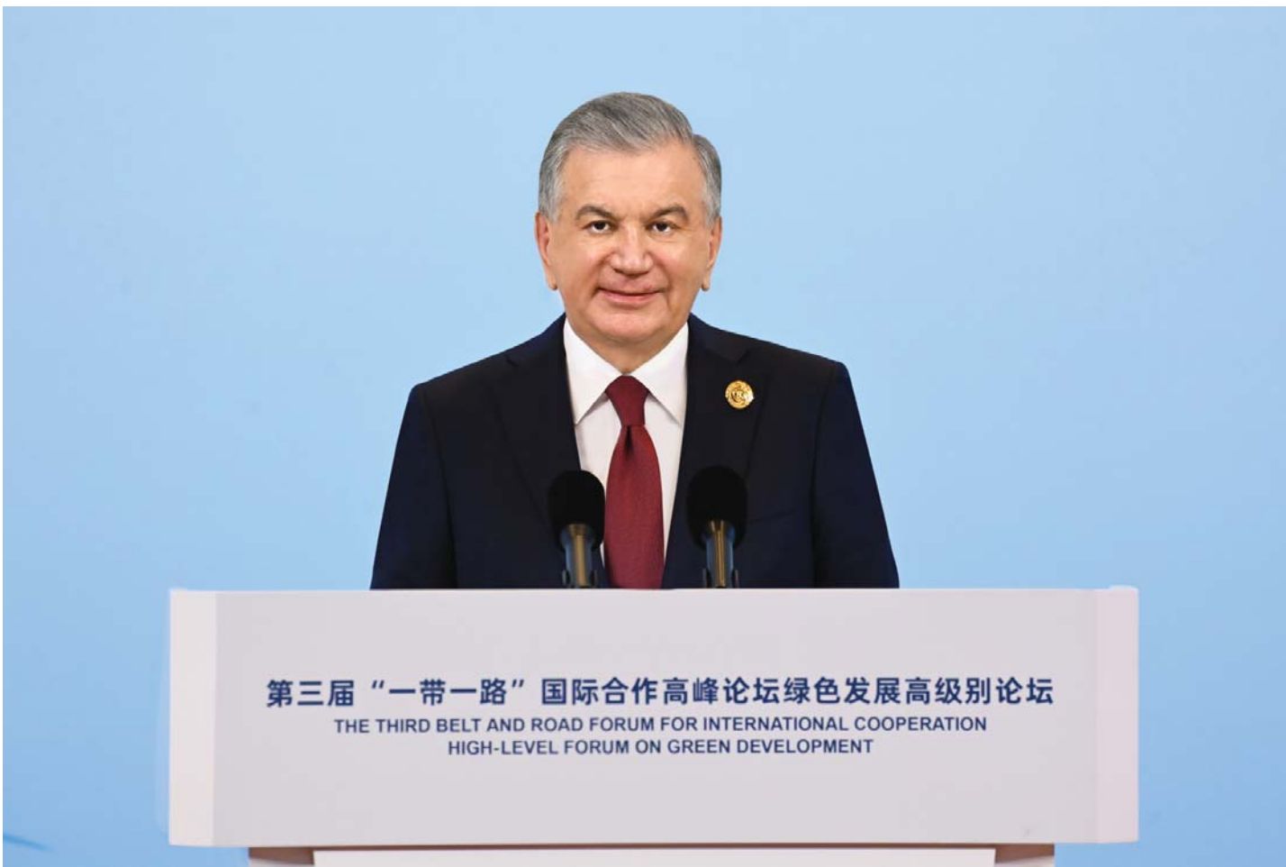
Третье «Один пояс, один путь» Международное сотрудничество на высшем уровне THE THIRD BELT AND ROAD FORUM FOR INTERNATIONAL COOPERATION HIGH-LEVEL FORUM ON GREEN DEVELOPMENT

Президент Республики Узбекистан Шавкат Мирзиёев по приглашению Председателя Китайской Народной Республики Си Цзиньпина 17—18 октября посетил город Пекин для участия в третьем Международном форуме «Один пояс, один путь».