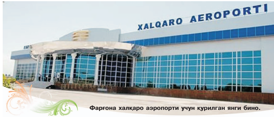
Фарғона халқаро аэропорти учун қурилган янги бино.

Фарғона шаҳридаги «Евросиё ТАПО-ДИСК» Ўзбекистон-Англия-Швейцария қўшма корхонасида маҳаллий автомобиллар учун 35 турдаги дисклар тайёрланади. Улкан ишлаб чиқариш мажмуаси ойига 100 минг дона маҳсулот ишлаб чиқариш қувватига эга. Бу ерда 500 нафарга яқин ўзбекистонлик ёш мутахассис меҳнат қилмокда.