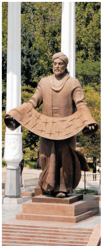
Фарғона шаҳрининг марказий хиёбони. Аҳмад ал-Фарғоний ҳайкали.