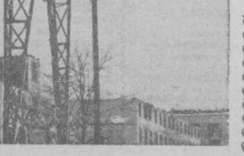
НА СНИМКЕ: монтаж готовых квартир в 10-м квартале Юго-Запада столицы.

Г. БАКШЕЕВА. Соб. корр. «Правды Востока».