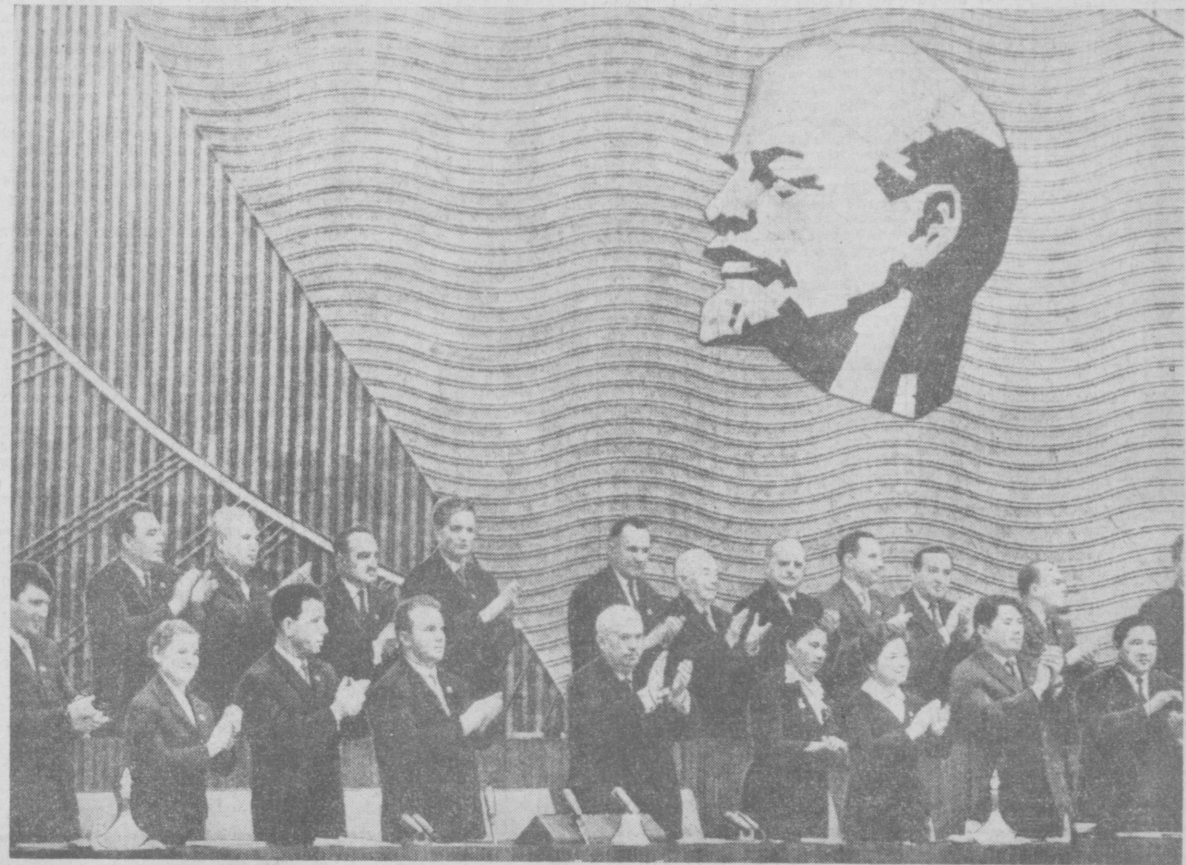
16 апреля в Москве, в Кремлевском Дворце съездов, открылся очередной XIV съезд Всесоюзного Ленинского Коммунистического Союза Молодежи. НА СНИМКЕ: в президиуме съезда. (Отчет о работе XIV съезда ВЛКСМ печатается на 2-й странице «Правды Востока»).

Н. ГЛАДКОВ. Соб. корр. «Правды Востока».