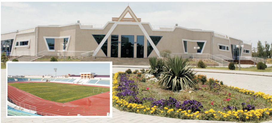
Навоийда қад ростлаётган спорт иншоотлари худудда болалар спортини ривожлантиришга қаратилган эътибор намунаси. БўСМлар, кураш мактаби, очик ва ёпиқ сув ҳавзаларига қатновчи ёшлар сони кун сайин ортиб бормоқда. Айниқса, «Ёшлар» спорт мажмуаси болаларни профессионал спортга элтвчи масканга айланиб улгурди. Бу ерда ёшлар енгил атлетика, гимнастика сингари бир қатор спорт турлари билан шуғулланади.