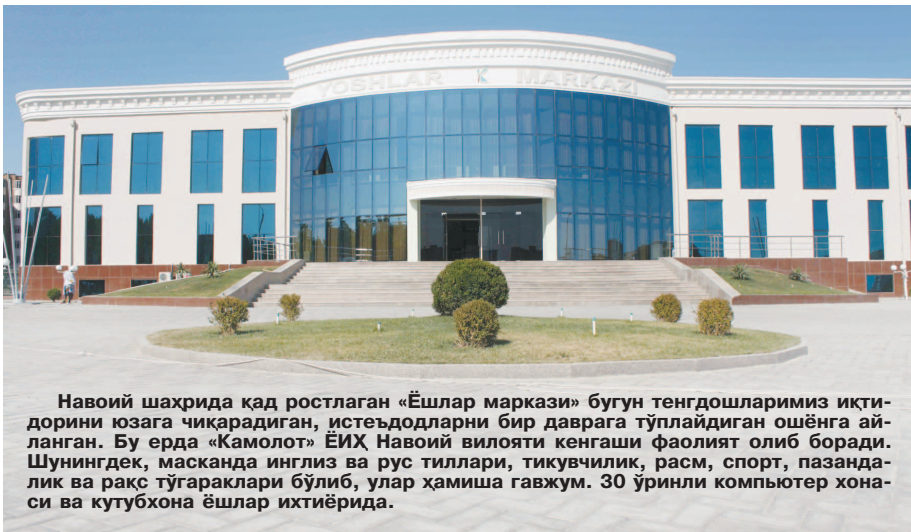
Навоий шаҳрида қад ростлаган «Ёшлар маркази» бугун тенгдошларимиз иқтисодини юзага чиқарадиган, истеъдодларни бир даврага тўплайдиган ошёнга айланган. Бу ерда «Камолот» ЁИХ Навоий вилояти кенгаши фаолият олиб боради. Шунингдек, масканда инглиз ва рус тиллари, тикувчилик, расм, спорт, пазандлик ва рақс тўғараклари бўлиб, улар ҳамиша гавжум. 30 ўринли компьютер хонаси ва кутубхона ёшлар ихтиёрида.