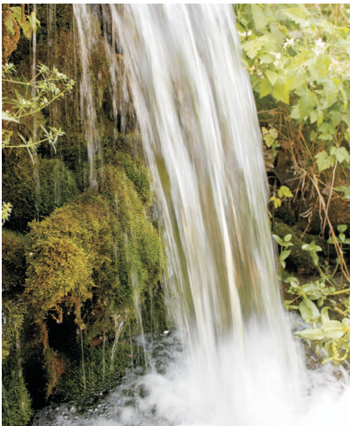
Нурота туманидаги Сентоб қишлоғи сўлим гўша. Эътиборлиси, қишлоқда енгил автомашина юрадиган жойлар кам. Тош сўқмоқлари ва гўзал шаршара уни бошқа кўп қишлоқлардан ажратиб туради.