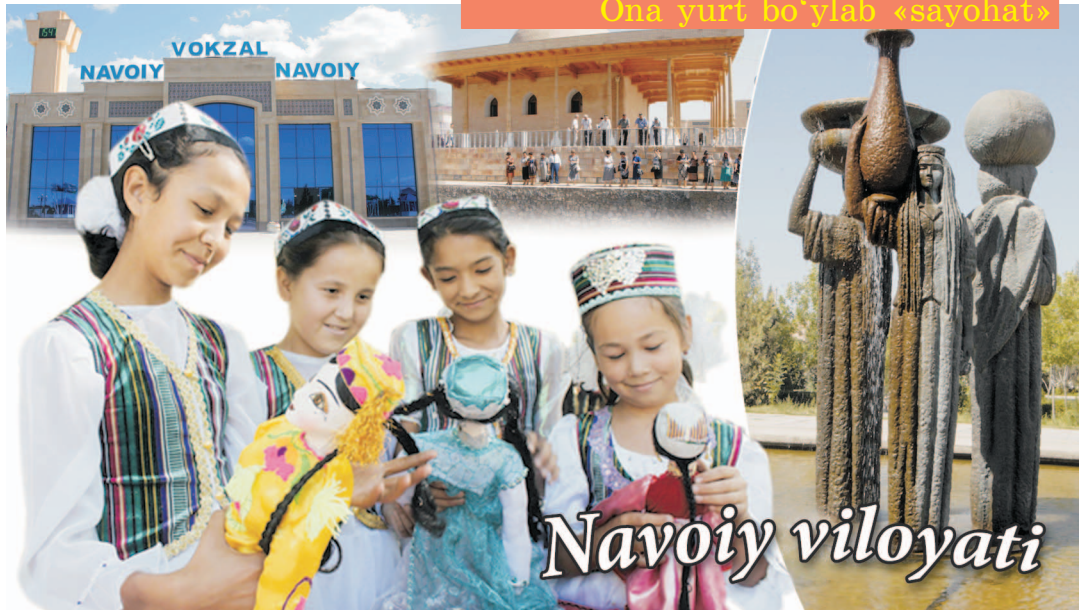
Ona yurt bo'ylab «sayohat»

Навоий вилояти республикамиз ижтимоий-иқтисодий, маданий-маърифий ҳаётида ўз ўрнига эга. Бугун вилоятда кончилик, металлургия, кимё, энергетика, қурилиш материаллари, пахта тозалаш ва озиқ-овқат саноати сингари соҳалар юксак ривожланган. Хусусан, 1040 та кичик ва 21 та йирик корхона фаолият кўрсатмоқда. Навоий кон-металлургия комбинати, «Навоийазот», «Қизилқумцемент», «Навоий иссиқлик электр станцияси» ОАЖлари, «Электркимё», «Бахттекстиль», «Навбахортекстиль» корхоналарини алоҳида эътироф этиш лозим. Худуднинг саноат салоҳияти ҳақида сўз кетганда «Навоий эркин индустриал-иқтисодий зона»сини таъкидлаш жоиз. Ҳозирги кунда бу ерда 14 та лойиҳа ишга тушган бўлиб, автомобиллар учун кабеллар ишлаб чиқаришга мўлжалланган «Uzeraecable» Ўзбекистон — Жанубий Корея, генераторлар ишлаб чиқарадиган «Uzeraealternator», рақамли телевидениелар учун тюнерлар ишлаб чиқарадиган «Telecom Innovations» Ўзбекистон — Сингапур қўшма корхоналари ва бошқа бир қатор ишлаб чиқариш объеклари етакчи қувватга эга.