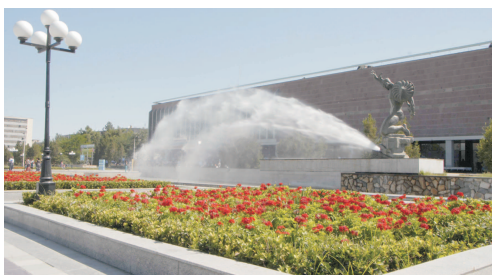
Навоий шаҳридаги «Фарҳод» ва «Ширин» маданият саройлари, «Навоий» боғи, «Ёшлик» кўли, халқ сайиллари ўтказиладиган, 2400 томошабинга мўлжалланган Амфитеатр шаҳар кўркига қурқ кўшиб турибди.