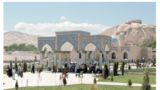
Нурота тумани вилоятда тарихий шаҳар, аъналар маркази деб юритилади. Худуд остонасида ястаниб ётган тарих Нурота зиёратгоҳида ўзининг бор бўй-басти билан намоён бўлади. Зиёратгоҳнинг сўл томонида Искандар қалъаси жойлашган. У чўл сарҳадидаги улкан истеҳком, муҳим савдо маскани ҳамда ҳарбий-стратегик пункт бўлган. Шаҳар жанубида қад кўтарган бу қадимий қалъа остида Нурота ариғи бошланадиган булок ва ҳовуз бор. Ҳовузда ҳам, ариқларда ҳам балиқ кўп. Нуроталиқлар ва бу ерга келадиган зиёратчилар балиқларни овламайди. Боиси, халқ таъбирига кўра, улар худди булок суви каби муқаддас.