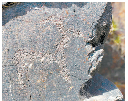
Қизилқум саҳроси бағрида сочилиб ётган ўрта плеолит даврига мансуб меҳнат қурооларининг топилши Навоий вилояти худудининг жуда қадимдан ибтидоий кишилар томонидан ўзлаштирила бошланганидан далолат беради. Сармишсой қояларида акс этган турли ҳайвонлар, ов манзаралари фикримизнинг яна бир тасдиғидир. Ҳозирда Сармишсой дараси ва унинг атрофидаги сойларда ўн мингдан ортиқ қоятош суратлари борлиги аниқланган. Мутахассисларнинг фикрича, ушбу петроглифлар ўзида 35 тематик образ ва сюжетларни акс эттиради.