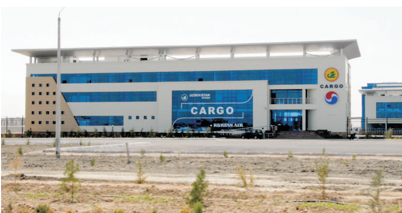
Навоий халқаро аэропортида бир кеча-кундузда 300 тонна қувватга эга бўлган халқаро андозаларга мос юк терминали ишлаб турибди.