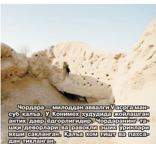
Чордара — милoddan аввалги Васрга мансуб қалъа. У Конимех худудида жойлашган антик давр ёдгорлиғидир. Чордаранинг ташқи деворлари ва равоқли ёшиқ ўринлари яхши сақланган. Қалъа хом ғишт ва паҳсадан тикланган.