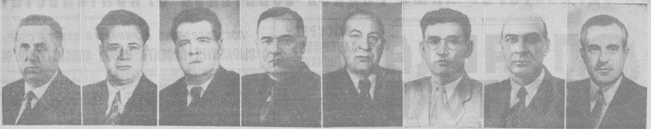
М. А. ЛЕСЕЧКО. Председатель комиссии Президиума Совета Министров СССР по внешнеэкономическим вопросам, министр СССР. Н. С. ПАТОЛИЧЕВ. Министр внешней торговли СССР. В. Г. БАКАЕВ. Министр морского флота СССР. Б. П. БЕЩЕВ. Министр путей сообщения СССР. Е. П. СЛАВСКИЙ. Министр среднего машиностроения СССР. И. Т. НОВИКОВ. Министр строительства электростанций СССР. Е. Ф. КОЖЕВНИКОВ. Министр транспортного строительства СССР. В. П. ЕЛЮТИН. Министр высшего и среднего специального образования СССР.