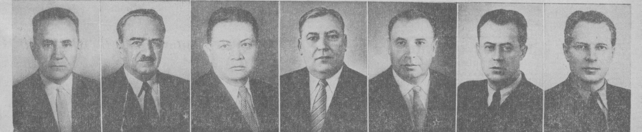
А. Н. КОСЫГИН. Первый заместитель Председателя Совета Министров СССР. А. И. МИКОЯН. Первый заместитель Председателя Совета Министров СССР. А. Ф. ЗАСЯДЬКО. Заместитель Председателя Совета Министров СССР, председатель Государственного совета научно-экономического совета Советов Министров СССР. И. Г. ИГНАТОВ. Заместитель Председателя Совета Министров СССР, председатель Государственного комитета заготовок Советов Министров СССР. В. Н. НОВИКОВ. Заместитель Председателя Совета Министров СССР, председатель Госплана СССР. К. Н. РУДНЕВ. Заместитель Председателя Совета Министров СССР, председатель Государственного комитета Совета Министров СССР по координации научно-исследовательских работ. Д. Ф. УСТИНОВ. Заместитель Председателя Совета Министров СССР.