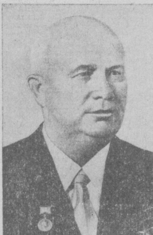
Н. С. ХРУЩЕВ. Председатель Совета Министров СССР.

Товарищи депутаты! Время, в которое мы живем, озабочено немержущим савом восточных идей XXI съезда КПСС. Яркими лучами солнца проникли они во все уголки земного шара, зажегали сердца людей великой верой в прекрасное будущее.