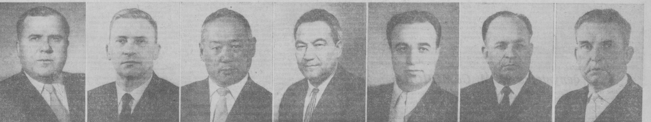
А. Ф. ДИОРДИЦА. Председатель Совета Министров Молдавской ССР.