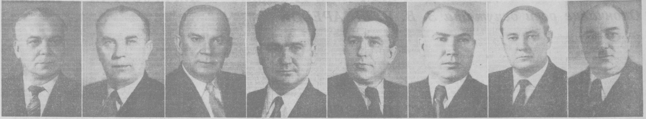
Г. В. ЕНУТИН. Председатель комиссии Государственного контроля Совета Министров СССР.