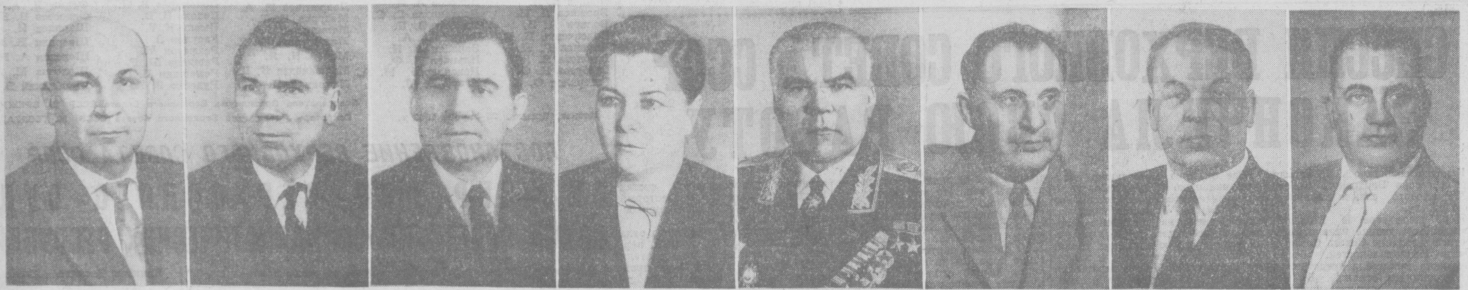
А. В. СИДОРЕНКО. Министр геологии и охраны недр СССР. С. В. КУРАШОВ. Министр здравоохранения СССР. А. А. ГРОМЫКО. Министр иностранных дел СССР. Е. А. ФУРЦЕВА. Министр культуры СССР. П. Я. МАЛИНОВСКИЙ. Министр обороны СССР. Н. Д. ПСРЦЕВ. Министр связи СССР. К. Г. ПЫСИН. Министр сельского хозяйства СССР. В. Ф. ГАРБУЗОВ. Министр финансов СССР.