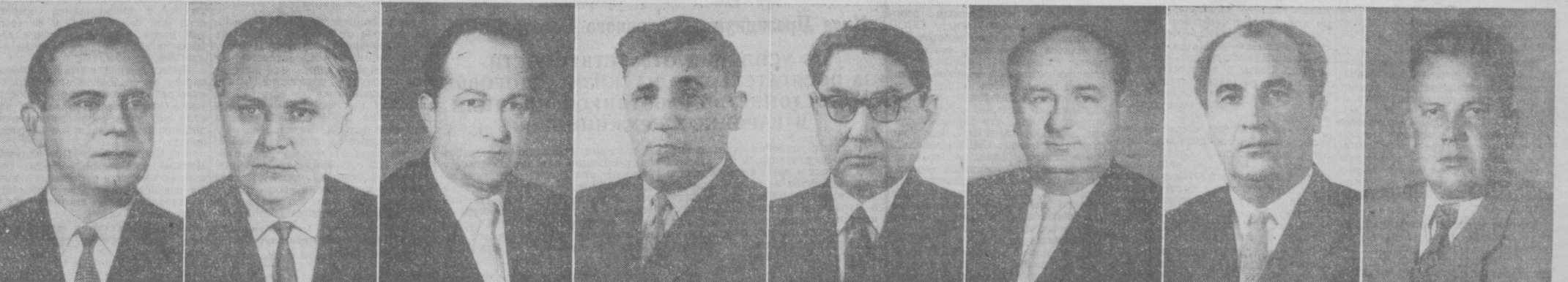
Д. С. ПОЛЯНСКИЙ. Председатель Совета Министров РСФСР.