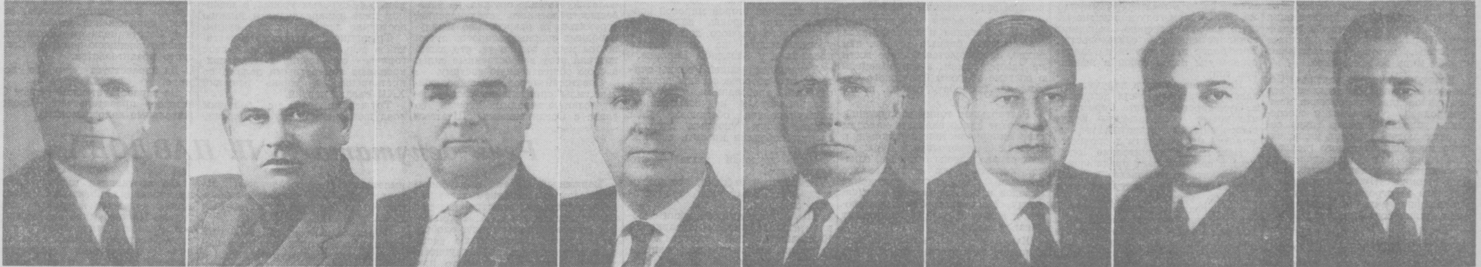
А. И. ШОКИН. Председатель Государственного комитета Совета Министров СССР по электронной технике, министр СССР.