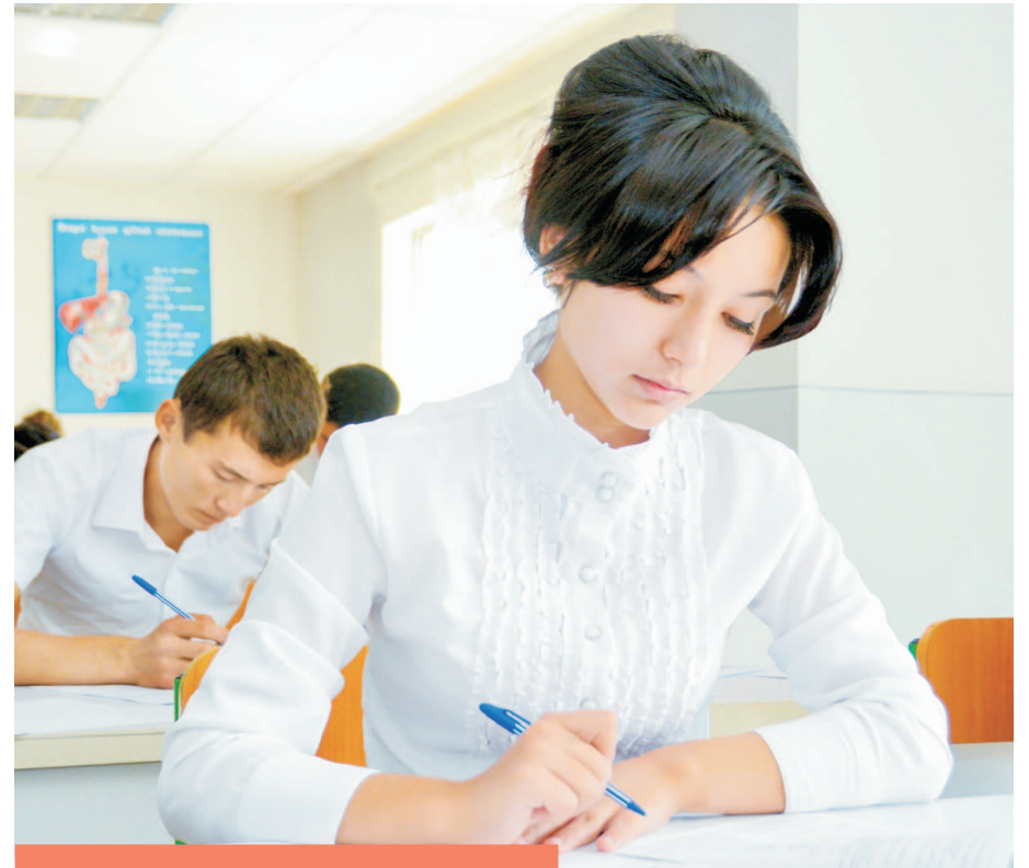
«Abituriyent — 2014»