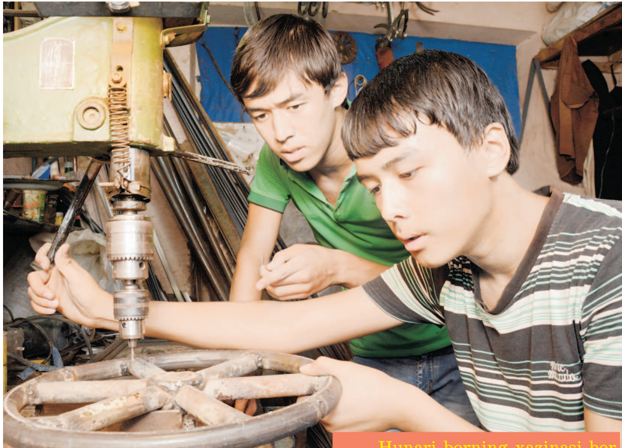
Hunari borning xazinasini bor

Инсоннинг меҳри ҳатто темир-ни ҳам юмшатишга қодир. Хунари энг қаттиқ жисмларни ҳам «бўйсундиради».