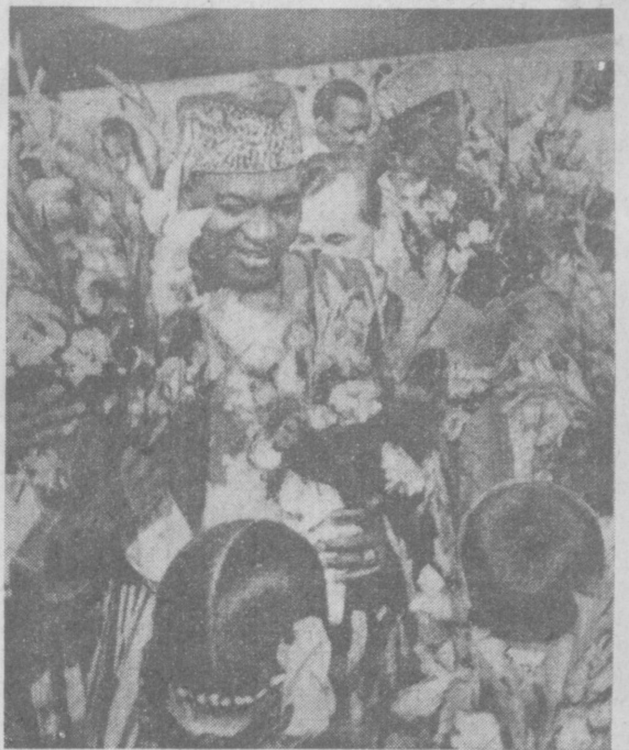
Встреча в Ташкентском аэропорту.

Поэтому мы рассматриваем поездку в Советский Союз не только в плане обычных традиционных поездок и обменов визитами между главами государств и прави-