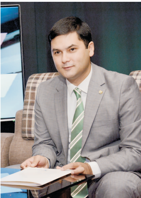
— Бу учрашувда сиз кутган, лекин берилмаган савол борми? — Ёшларнинг етакчиси сифатида келгуси режаларни тўғрисидаги саволни кутганим.

— Ижтимоий фаолият нима? Яна юқоридagi мазгуга қайтаман. Тадбиркорлик билан шуғулланиш ҳам ижтимоий фаолиятнинг бир қириниши. Уйлашимча, маҳалладаги ёшларнинг ичига чуқурроқ кириб бориб, улар билан семинар-тренинглари ўтказиб, тадбиркорлик соҳасига жалб қилса ёки касб-ҳунар ўрганишига қўмақлашсақ, бу ёшлар ўзини албатта кўрсатади, юрт қорига ярайди. Барча ёмонлик ва иллатлар бекорчиликлдан келиб чиқади. Маҳаллада икки-учта уюшмаган ёш бекор қолдим, бирор қор-ҳолни бошлайди. Шу боис бундан вақти қилишига имкон туғдирмаслик керак. Бир неча йил олдин Тошкент шаҳридаги маҳаллаларда, асосан, кўп қаватли уйлар атрофида сунъий қопламали футбол майдонлари ташкил этила бошланди. Нимага уларнинг сонини кўпайтириш мумкин эмас? Шунда янаам кўпчиликда спорт билан мунтазам шуғулланиш имкони туғилади. Бизга энгил атлетика, волейбол ва бошқа шунга ўхшаш спорт турларига мослаштирилган махсус майдончалар ҳам керак. Ҳозир хар бир ёшнинг қўлида мобил телефон бор. Маҳаллаларда бепул интернет учун Wi-Fi ҳудудлари янги ташкил этишга нима халақит берапти? Ёшлар мобил интернетдан «WhatsApp» ёки «Telegram» каби ижтимоий тармоқлар эмас, айтиш мумкин ижобий ҳал қилишга доир тақрифларимизни шаҳар ҳокимига берганимиз. Умид қиламаник, бекорчи ёшларнинг фойдали машғулотлар билан шуғулланиши учун қанчалик имконият туғдирсақ, бекорчилик муаммоси шу қадар ижобий ечим топади.