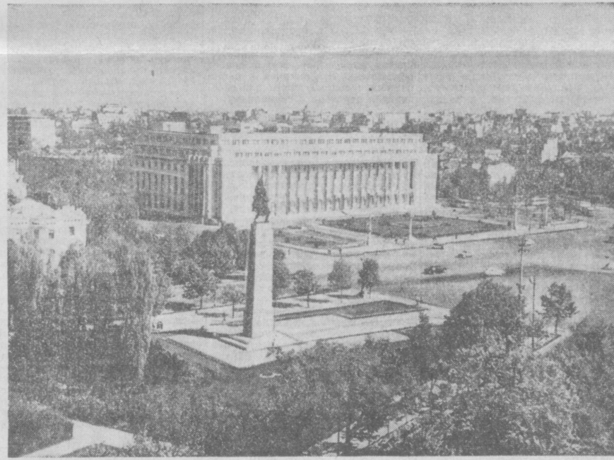
РУМЫНСКАЯ НАРОДНАЯ РЕСПУБЛИКА. БУХАРЕСТ. ЗДАНИЕ СОВЕТА МИНИСТРОВ РНР.

Животноводы колхозов Свердловского района досрочно выполнили двенадцатимесячный план сдачи мяса государству. За пять с половиной месяцев хозяйства района продали 559 тонн мяса. Особенно высокие показатели достигли сельхозартели «Коммунизм», имени Кирова, имени Ахунбаева, имени Ленина, выполнявшие двенадцатимесячные задания на 110—115 процентов.