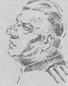
Народный артист РСФСР Н. Г. Колодийкин в роли Шмидта в спектакле «Игра без правил».