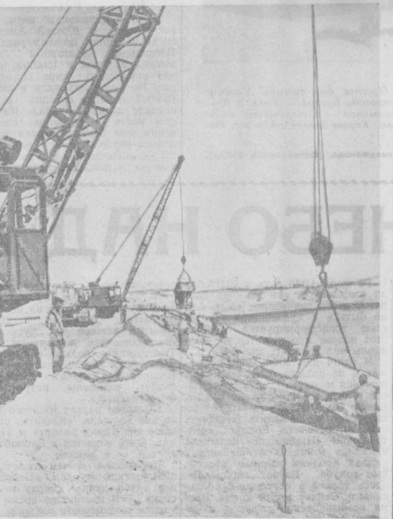
Тысячи кубометров грунта укладывают ежедневно строители платины Южносухандарьинского водохранилища. С каждым днем повышается уровень воды в его гигантской чаше. На фото уже свыше пятидесяти миллионов кубометров на площади 15 тысяч квадратных метров. НА СНИМКЕ: укладка бетонных плит на откосе платины.

Советское правительство, говорится в ноте, ожидает, что правительство США примет надлежащие меры к выдаче советским властям военного преступника Импулявичюса, ответственного за кровавые злодеяния и преступления против человечества.