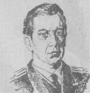
Народный артист РСФСР, лауреат Государственной премии А. А. Попов в роли Платонова в спектакле «Океан».