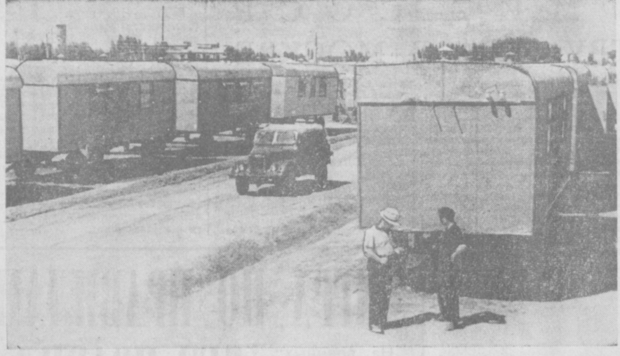
Еще недавно здесь, неподалеку от Уречма, был пустырь. А ныне раскинулся поселок строителей газопровода Бухара — Урал. В благоустроенных домиках к услугам газопровод — электричество, водопровод, телевизоры, радиоприемники. Короче говоря, здесь все, как и в большом городе.

Около тридцати стендов занято в Ташкентском окружном доме офицеров фотовыставкой «Бухарест — столица Румынской Народной Республики». Выставка направлена в столицу Узбекистана — Румынским обществом дружественных связей с СССР. Бухарест со времени своего основания насчитывает более 500 лет. На фотграфиях видны многие старинные здания. Но сегодня в них новая жизнь. Столица Румынии переживает вторую молодость. На широких проспектах и вдовь теннисных бульваров вырастают новые жилые дома. Побывавши на фотовыставке «Бухарест — столица Румынской Народной Республики» и кажется, будто побывали мы в Бухаресте, познакомившись со всей братской страной. М. ПЕТРОВ.