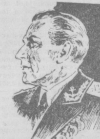
Заслуженный артист РСФСР, лауреат Государственной премии М. М. Майоров в роли Чемезова в спектакле «Якорная площадь».

Нелегка жизнь дорожника. И тем более уважаешь такого человека, как дорожный мастер Негерчук, которому 65 лет, который пришел на Узбекский тракт