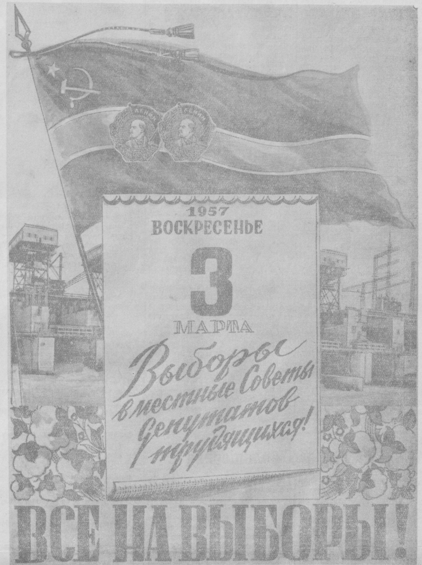
Плакат П. Шахназарова.

Президиум ВЦСПС рекомендует центральным, республиканским, областным и фабрично-заводским комитетам профсоюзов организовать совместно с хозяйственными организациями и научно-техническими обществами на предприятиях и по отраслям промышленности конкурсы на лучшее предложение по рациональному расходованию сырья, топлива, электроэнергии, металла и других материальных ресурсов, по комплексному использованию сырья при его переработке, внедрению дополнительных резервов для переработки дефицитных и дорогостоящих видов сырья.