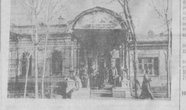
На снимке: здание бывшего Общественного собрания на Гоголевской улице, где с 1917 по 1921 год находился Ташкентский Совет.

Гостиница в Чимбае запущена, не отапливается, двери неисправны. Часто не бывает ни чая, ни воды. М. ТКАЧЕНКО.