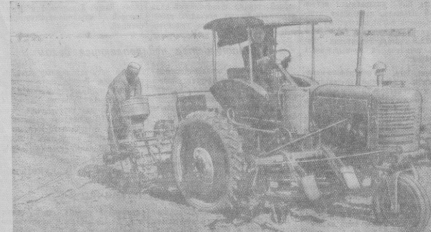
В южных районах Сурхан-Дарьинской области начался квадратно-гнездовой сев тонковолокнистого хлопчатника. На снимке: сев хлопчатника на полях колхоза имени Сталина, Термезского района.