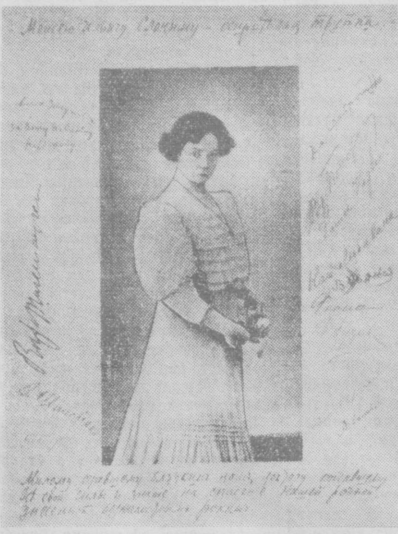
...17 января 1910 года в помещении Городского общественного собрания на улице Гоголевской, где сейчас кинотеатр «30 лет комсомола», начал свои гастроли в Ташкенте знаменитый петербургский театр Комиссаржевской.