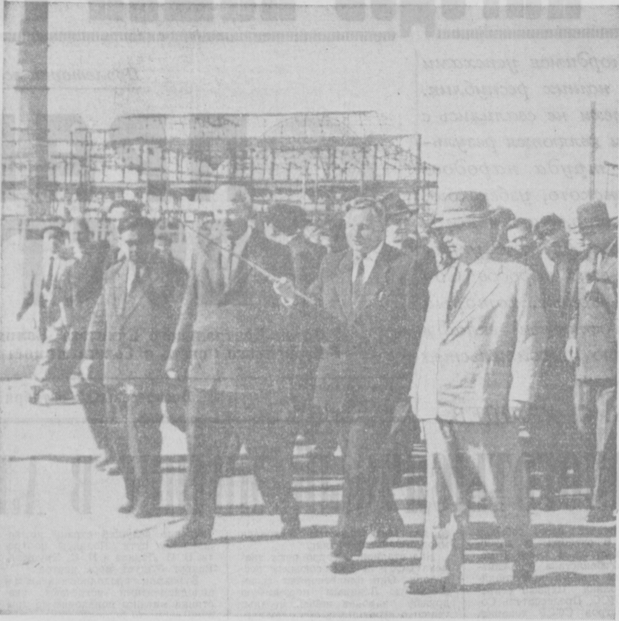
Никита Сергеевич Хрущев знакомится с производственными объектами меднообогатительной фабрики Алтынопанского комбината имени В. И. Ленина.

Мы рады доложить родной партии, что строители и монтажники поработали на совесть, — горюют оратор. — Нелегким был путь к победе. Но, как подобает советским людям, мы не привыкли отступать. И вот результат: работа наша фактура, хорошо работает. Это наш подарок Советской Родине, подарок к ее 45-летию юбилею.