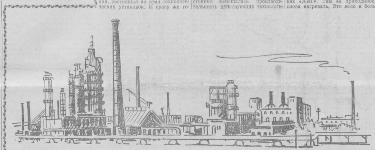
Вот он, нефтеперерабатывающий завод — гордость Ферганы

Центральный Комитет КПСС и Совет Министров СССР горячо поздравляют трудящихся Мордовской АССР с успешным выполнением социалистических обязательств по продаже зерна государству и выражают уверенность в том, что они еще настойчивее будут бороться за выполнение решений XXII съезда партии и мартовского Пленума ЦК КПСС, за дальнейшее