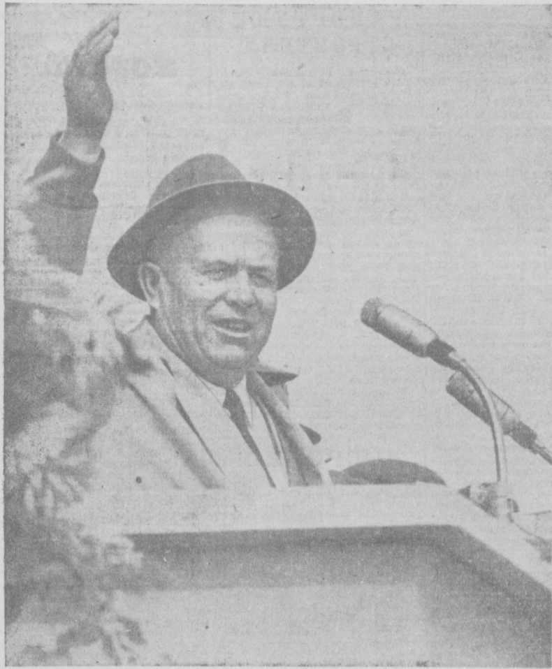
Никита Сергеевич Хрущев выступает на митинге трудящихся Алмалыка.

Мы гордимся успехами народов наших республик. Эти успехи не свалились с неба, они являются результатом труда народов: туркменского, узбекского, таджикского, казахского, киргизского, русского, украинского, всех народов Советского Союза, которые вносят достойный вклад в общее дело строительства коммунизма.