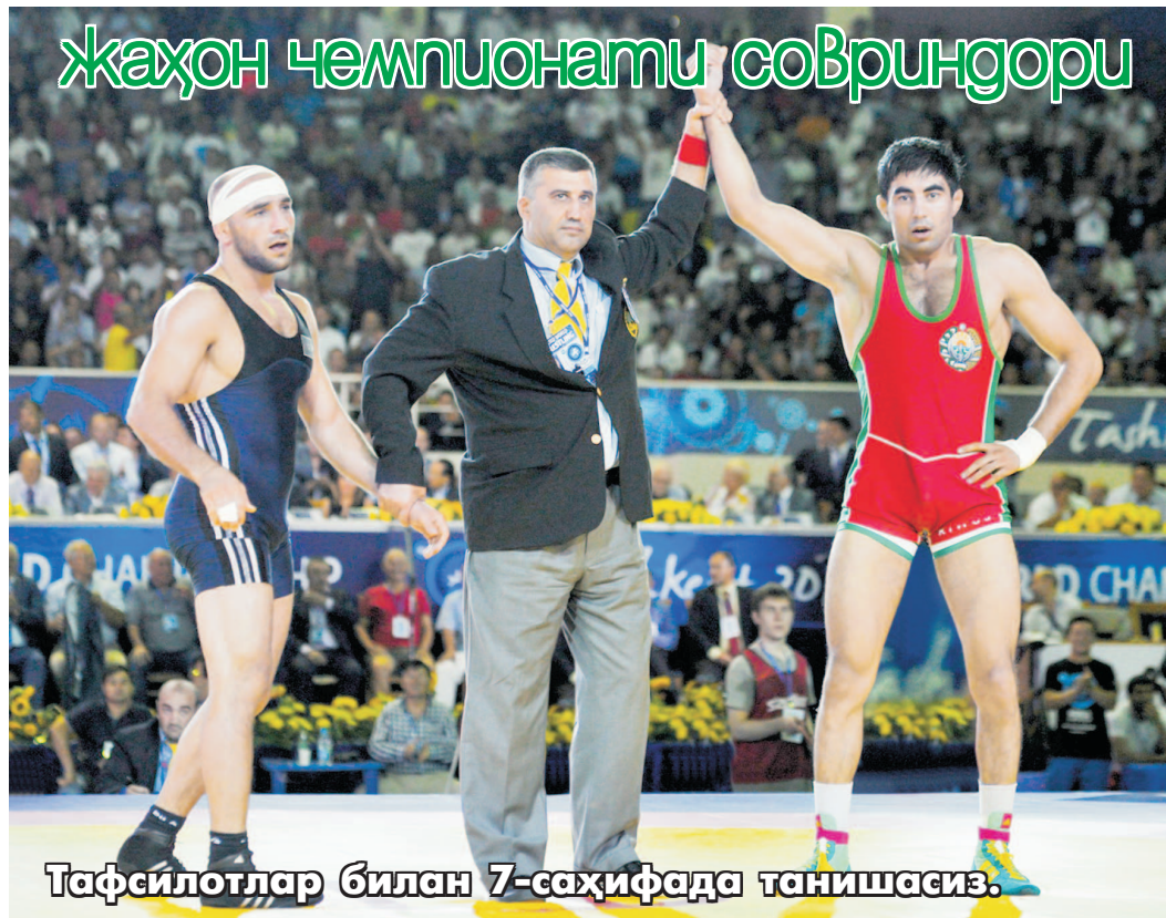
Тафсилотлар билан 7-саҳифада танишасиз.