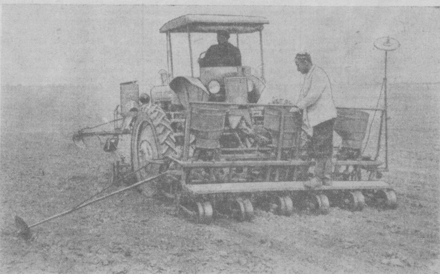
На юге Узбекистана шире развертываются весенние посевные работы. Сев хлопчатника ведут многие колхозы. На снимке: квадратно-гнездовой сев хлопчатника в колхозе «Намуна», Термезского района, Фого А. Кима. (Фотохроника УзТАГ).

Пленум обсудил также ряд сообщений об оздоровительной работе в домах отдыха, о культурно-массовой работе в здравницах, о научно-исследовательских работах институтов курортологии и физиотерапии. (ТАСС).