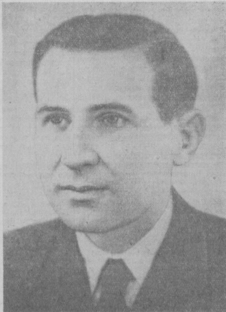
МЕХМЕТ ШЕХУ — Председатель Совета Министров Народной Республики Албании.