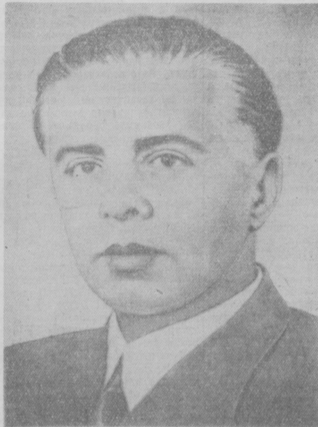
ЭНВЕР ХОДЖА — Первый секретарь ЦК Албанской партии труда, член Президиума Народного собрания.