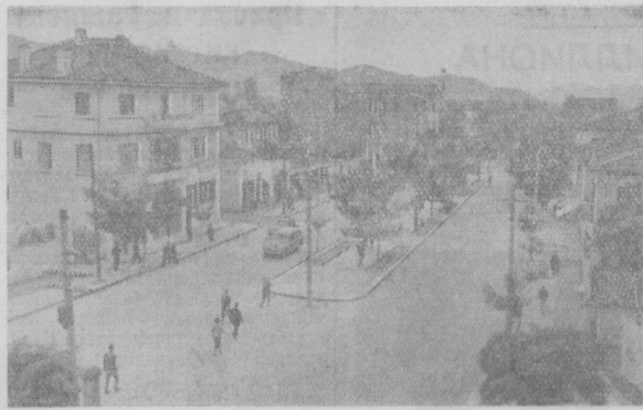
Столица Народной Республики Албании — город Тирана.