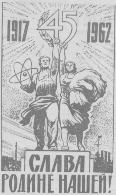
Плакат художника Б. Васильева.