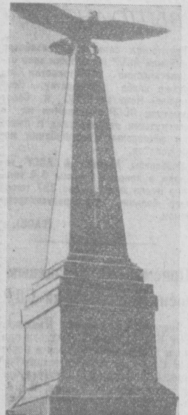
Памятник М. И. Кутузову на Бородинском поле.

Народы всех стран! Будьте бдительны, разоблачайте империалистических поджигателей войны! Активнее боритесь за обеспечение прочного и нерушимого мира!