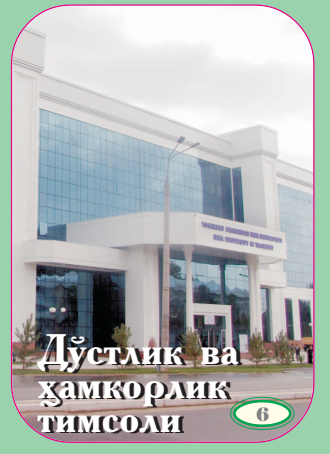
Дўстлик ва ҳамкорлик тимсоли