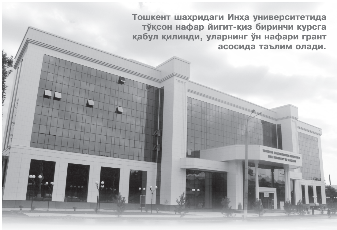
Тошкент шаҳридаги Инха университетиди тўксон нафар йигит-қиз биринчи курсга қабул қилинди, уларнинг ўн нафари грант асосида таълим олади.

Бу ҳақда Тошкентдаги Инха университетининг очилиши ва янги ўқув йилининг бошланишига бағишланган тадбирда сўз борди. Унда Ўзбекистон Республикаси Бош вазирининг ўринбосари А.Икромов, Жанубий Кореянинг Инха университети пре-