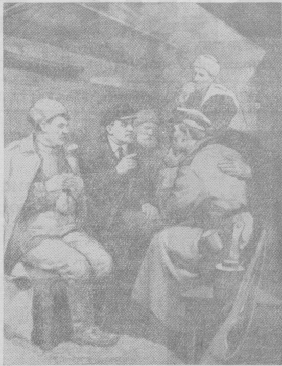
В. И. Ленин по дороге в Петроград в 1917 г. Рисунок художника П. Васильева.