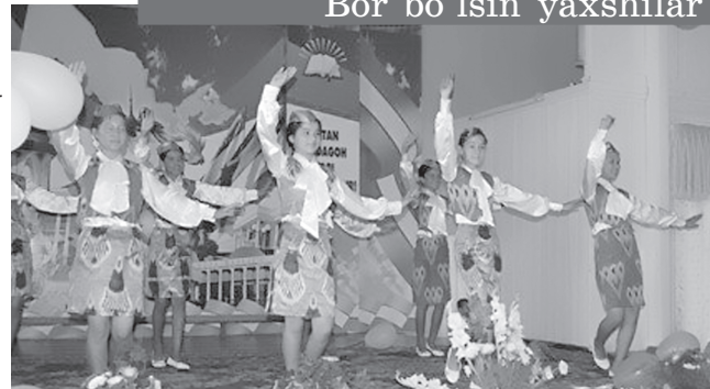
Bor bo'lsin yaxshilar

Давлатимиз ғамхўрлиги остида тарбияланаётган, ўқиб-излана-