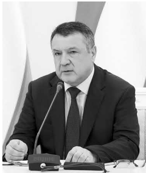
Нуриддинжон ИСМОИЛОВ, Олий Мажлис Қонунчилик палатаси Спикери:

— Ўтган ҳафта мамлакатимизда 21 октябрь – Ўзбек тили байрами кўни жуда кенг нишонланди.