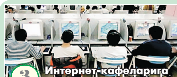
3 Интернет-кафеларига рейд