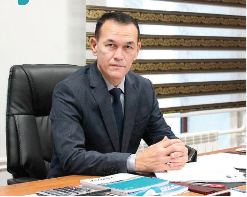
Даўйтбай ҚУРБАНИЯЗОВ, Қорақалпоғистон Республикаси Жўқорғи Кенгеси депутати

Жамият ва давлат тараққиёт этишида ҳар бир фуқаро ўз ҳуқуқ ва мажбуриятлари доирасида, зиммасига юклатилган вазифаларини сидқийдан адо этиши катта аҳамият касб этади. Қолаверса, ўз юрти ва давлатига меҳр-муҳаббат ва садоқат билан хизмат қилиши ҳар бир инсоннинг муқаддас бурчи ва энг олий саодатидир.