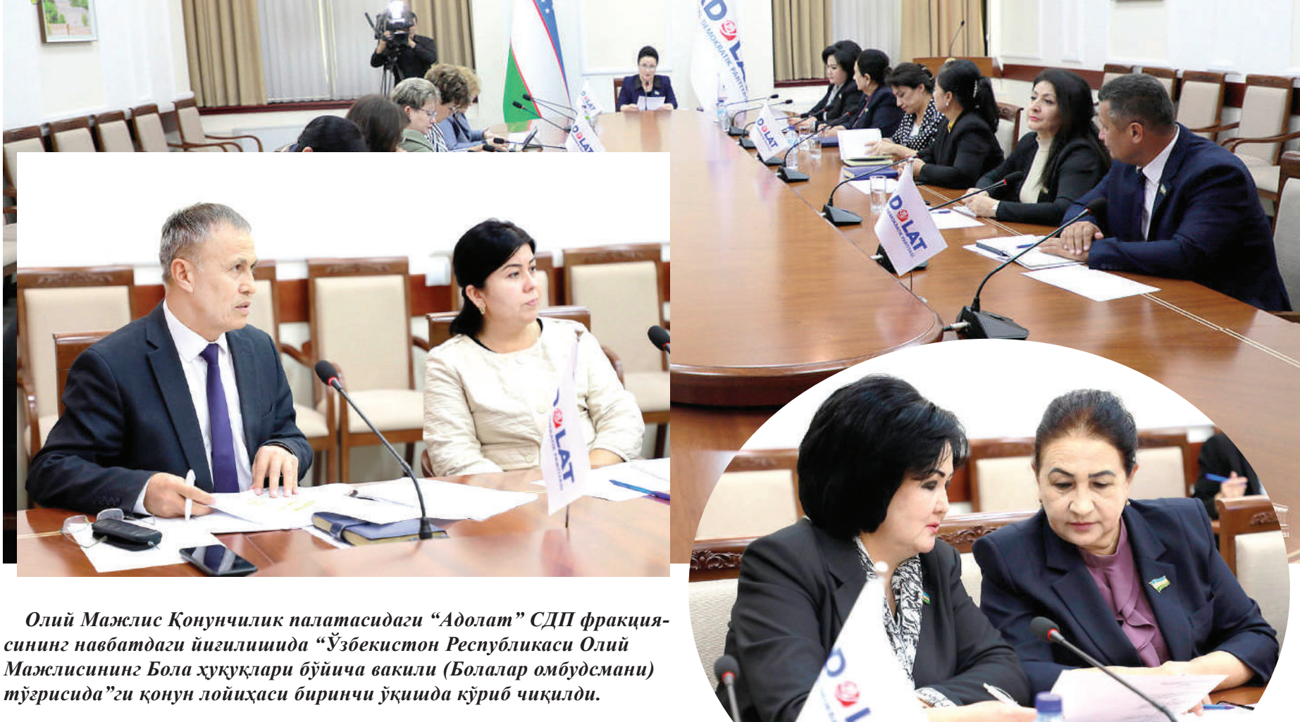
Олий Мажлис Қонунчилик палатасидаги “Адолат” СДП фракциясининг навбатдаги йиғилишида “Ўзбекистон Республикаси Олий Мажлисининг Бола ҳуқуқлари бўйича вакили (Болалар омбудсмани) тўғрисида”ги қонун лойиҳаси биринчи ўқишда кўриб чиқилди.