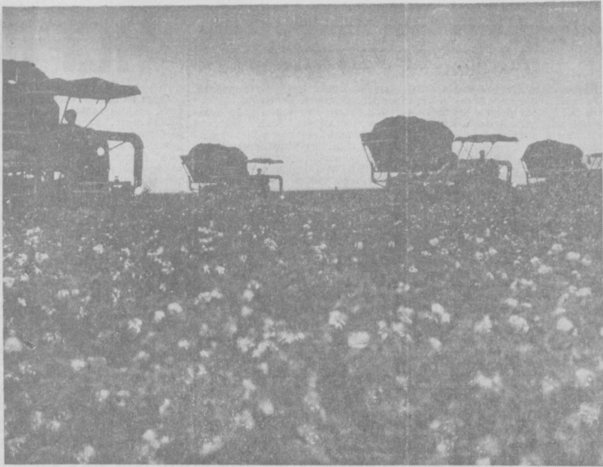
Механики-водители из совхоза «Талимаран» Ангорского района с каждым днем наращивают темпы уборки. Став на ударную предоктябрьскую вахту, труженники третьего отделения хозяйства ежедневно едут на заготовительный пункт два-два с половиной процента сырья с содовой плем. На СНИМ-КЕ: ночной сбор хлопка в совхозе «Талимаран».

Фото А. Горюхина и А. Кима. (Фотохроника УЗТАГ).