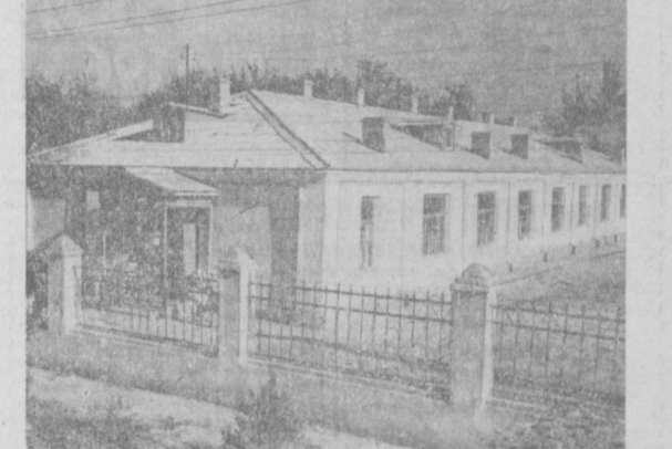
Новый ридольный дом в колхозе имени Энгельса Ленинского района Андижанской области построила межколхозная строительная организация. Ее коллектив добросовестно выполнил договоры. А за цифрами плана — новые жилые дома и школы, павильоны стам и гаражи, свинарники и коровники. Сейчас началось строительство трехсот жилых домов вдоль дороги Кува—Андижан.