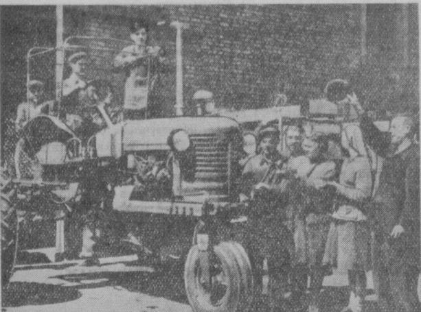
Ташкент. Завод «Ташсельмаш» имени К. Е. Ворошилова. На снимке: Трактор выходит из ворот сборочного цеха.

Материалы этой страницы подготовил старший преподаватель ТашФЭИ Ф. МУКМИНОВ, картограф В. ЛЕОНТЬЕВА, сотрудник «Правды Востока» М. ЛЯХОВСКИЙ Л. ТОПОРКОВ.