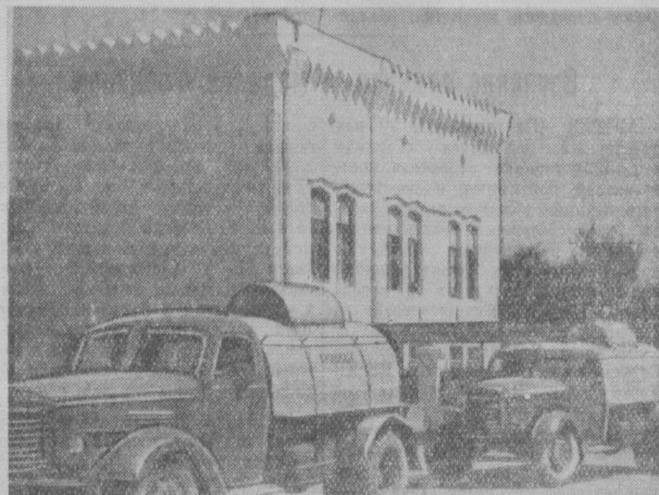
Чирчик. На снимке: автомашин с жидким аммиаком выходят из ворот Чирчикского электромеханического комбината.