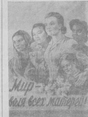
Плакат М. Тондае. (Изюги).

В Узбекистане, например, имеется более 5 тысяч школ, в которых работают 60 тысяч учителей. В Ташкенте, кроме 150 школ, имеется