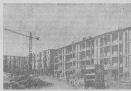
Мы приложим все силы к тому, чтобы все свои знания, весь опыт вложить в благородный труд строителя. Мы хотим заслужить и мы заслужим благодарность трудящихся Ташкента, славя 40-й годовщину Великого Октября...

Каждый понимает, что сейчас нельзя быть хорошим строителем, не имея знаний. Все мы учимся, повышаем квалификацию, стремимся добиться совершенства в своей профессии.