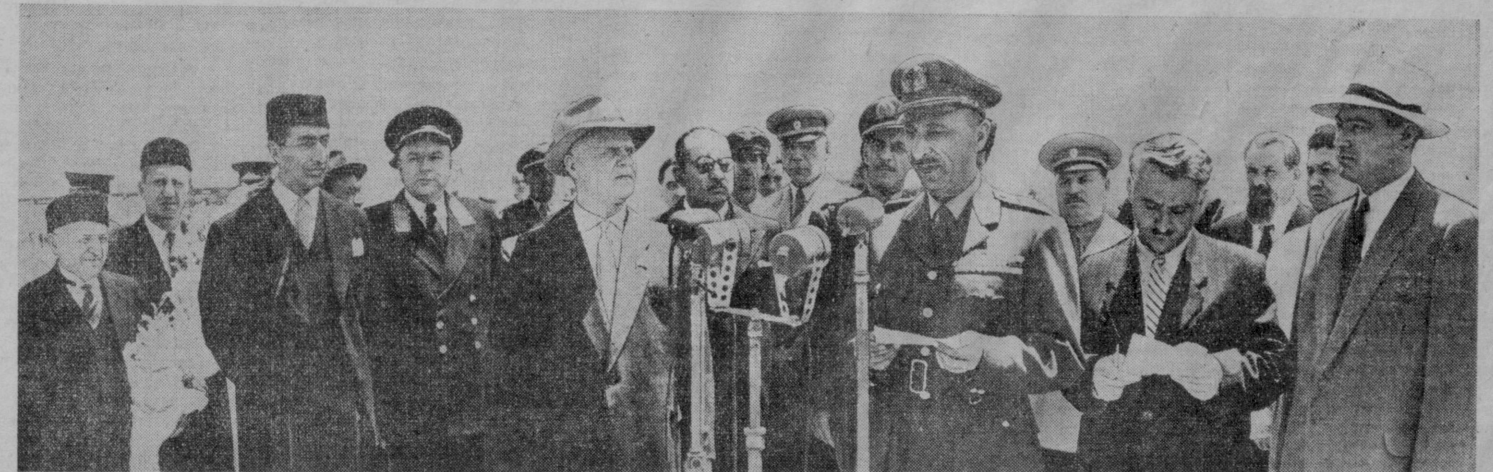
На снимке: встреча короля Афганистана Мухаммед Захир шаха и сопровождающих его лиц в Ташкентском аэропорту.