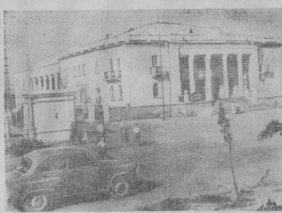
Гор. Чирчик. Дворец культуры «Средазхизма».