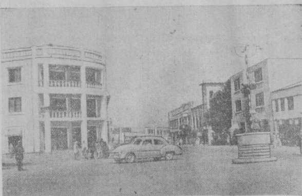
Столица Афганистана — Кабул является самым крупным городом страны.

В сообщении говорится, что 11 и 12 июля с. г. состоялся пленум Центрального Комитета Болгарской коммунистической партии.