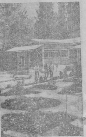
Заботой и любовью окружены престарелые колхозники в сельхозартеле имени Хрущева, Орденознаменского района. Здесь впервые в столичной области Узбекистана для них открыт дом, где одинокие престарелые колхозники обеспечены не только жильем, но и питанием.

Команда с городом, его достопримечательностями, очагами культуры и отдыха. К группам гостей (25—30 человек) прикрепляются сопровождающие и переводчики, специально подготовленные к встрече.