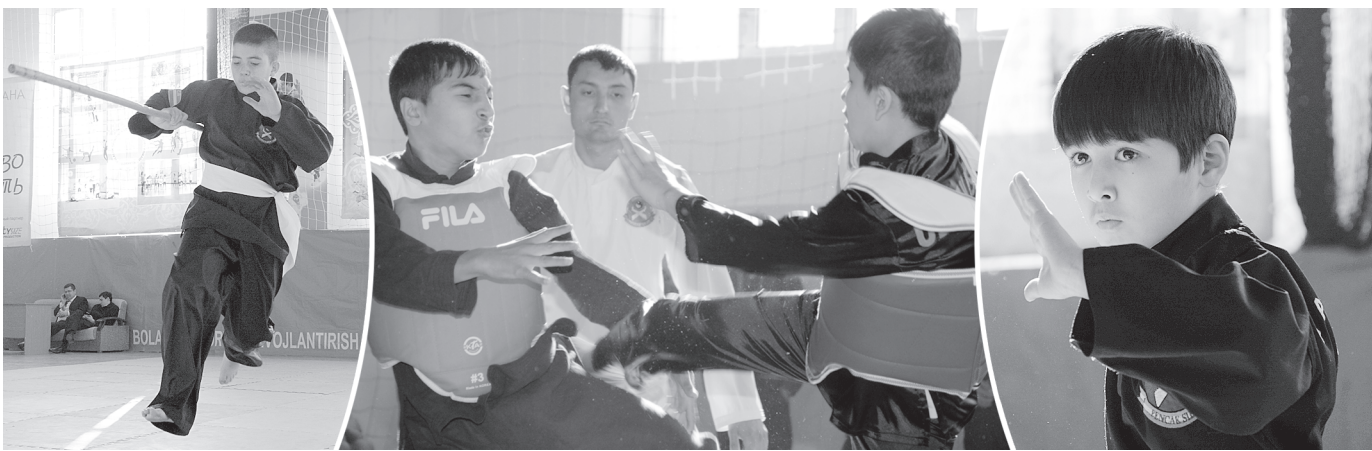
(Давоми, бошланиши 1-саҳифада)

Ўзбекистонда пенчак силат федерациясига 2009 йил 9 мартда асос солинган, барча вилоятларда филиаллари фаолият кўрсатмоқда. Бугунги кунда қирқ нафардан ортиқ мураббий икки мингдан зиёд ўғил-қизларга пенчак силат сирларини ўргатмоқда. Қисқа вақт мобайнида мамлакатимиз терма жамоаси шу спорт тури бўйича кўплаб халқаро турнирларда иштирок этиб, ғалабаларга эришди. Ушбу турнир эса пенчак силатни янада оммалаштиришга, бўлғуси чемпионларни тайёрлашга хизмат қилади.