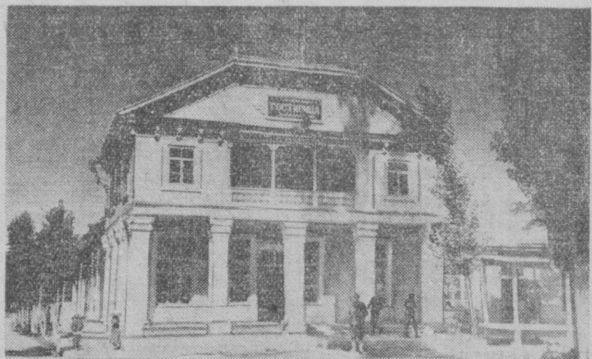
Гостиница Заркентского сельпо.

На Всесоюзной сельскохозяйственной выставке, в павильоне Центрального зала, ежегодно широко показывается опыт работы Заркентского сельпо. Янги-Курганского района. Представлен он и в нынешнем году. Тысячи людей внимательно осматривают экспонаты, диаграммы, фотографии. Десятки вопросов задаются экскурсоводам: как, каким путем достигнуто все это?