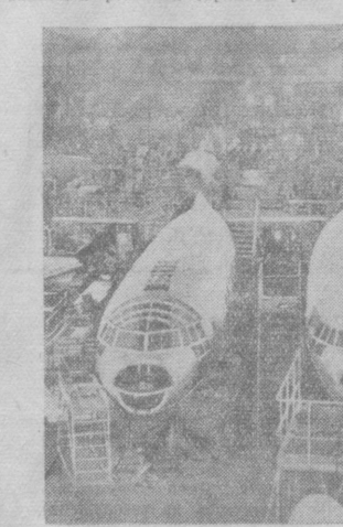
Слева: один из огромных цехов народного предприятия «Индустриерк» в Дрездене. Здесь монтируются фрезельки Ил-14.

СЕП и правительство ГДР уделяют большое внимание повышению жизненного уровня населения. Неоднократно снижались розничные цены на товары широкого потребления и проведение других мероприятий по систематическому подъему материального благосостояния трудящихся привели к повышению реальной заработной ра-