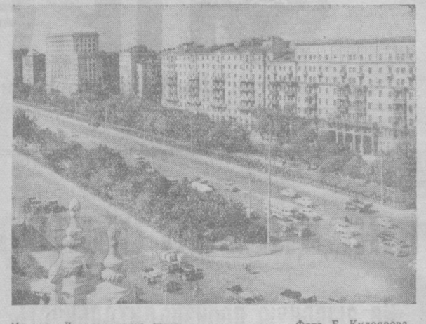
Москва. Ленинградское шоссе.