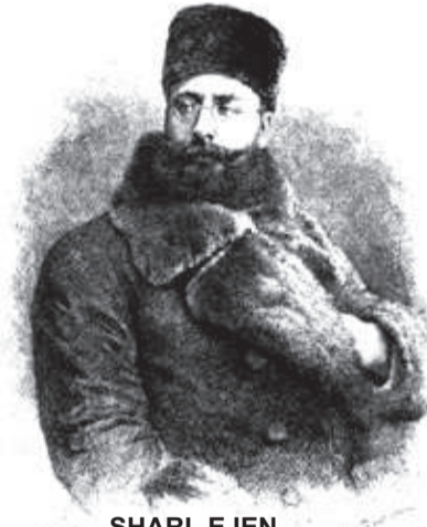
SHARL EJEN UYFALVI