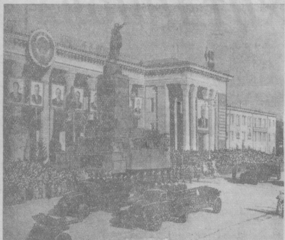
Ташкент, 7 ноября, 1957 года. Парад и демонстрация трудящихся на площади В. И. Ленина.