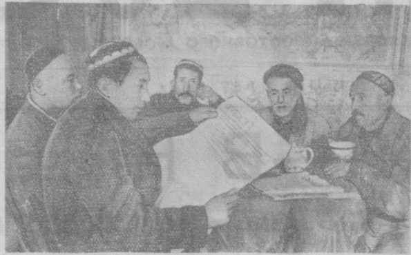
Трудящиеся Самарканда с горячим одобрением встретили Декларацию и Манифест мира, принятые на Совещаниях представителей коммунистических и рабочих партий социалистических стран. На предпринятых в учреждениях и учебных заведениях города проходят коллективные чтения этих исторических документов.