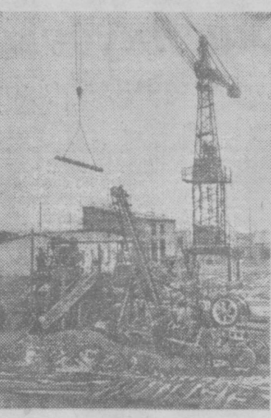
В Нукусе идет строительство полигонного завода железобетонных сборных конструкций. Он ежегодно будет выпускать более 8 тысяч кубометров этих изделий. К концу года ряд объектов нового предприятия будет сдан в эксплуатацию. На снимке: на промышленной площадке нового полигонного завода.

Отдел литературы стран народной демократии (г. Ташкент, ул. К. Маркса, 31). ВЫШЕЛ ИЗ ПЕЧАТИ и поступил в продажу АЛЬБОМ «КАРТИНЫ ИЗ КОЛЛЕКЦИИ ПРЕЗИДЕНТА РЕСПУБЛИКИ ИНДОНЕЗИИ Д-РА СУКАРНО». Альбом издан в 2-х томах, включающих 206 многокрасочных репродукций с картин, написанных более чем 70 художниками разных стран. Предисловие и подписи к репродукциям сделаны на русском языке. Альбом хорошо оформлен. Цена — 310 руб. МАГАЗИН № 1 «ТАШОВЛКНИГОТОРГ» Отдел литературы стран народной демократии (г. Ташкент, ул. К. Маркса, 31). ВЫШЕЛ ИЗ ПЕЧАТИ и поступил в продажу АЛЬБОМ «КАРТИНЫ ИЗ КОЛЛЕКЦИИ ПРЕЗИДЕНТА РЕСПУБЛИКИ ИНДОНЕЗИИ Д-РА СУКАРНО». Альбом издан в 2-х томах, включающих 206 многокрасочных репродукций с картин, написанных более чем 70 художниками разных стран. Предисловие и подписи к репродукциям сделаны на русском языке. Альбом хорошо оформлен. Цена — 310 руб. МАГАЗИН № 1 «ТАШОВЛКНИГОТОРГ» Отдел литературы стран народной демократии (г. Ташкент, ул. К. Маркса, 31). ВЫШЕЛ ИЗ ПЕЧАТИ и поступил в продажу АЛЬБОМ «КАРТИНЫ ИЗ КОЛЛЕКЦИИ ПРЕЗИДЕНТА РЕСПУБЛИКИ ИНДОНЕЗИИ Д-РА СУКАРНО». Альбом издан в 2-х томах, включающих 206 многокрасочных репродукций с картин, написанных более чем 70 художниками разных стран. Предисловие и подписи к репродукциям сделаны на русском языке. Альбом хорошо оформлен. Цена — 310 руб.